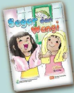
Buku Kecil Small book