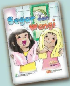
Buku Kecil Small book