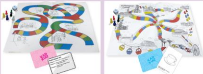
Mainan Berpapan Pendidikan Bahasa (Kit CEKAP) Educational Language Board game